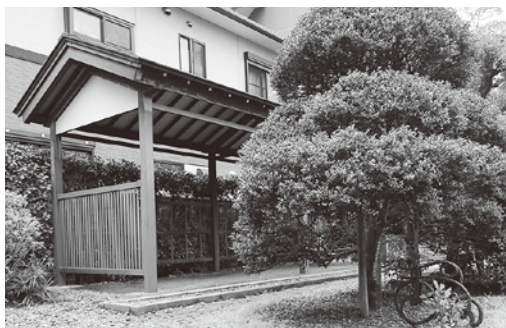
自転車置場と鍛鉄のオブジェ

通りに面しては、木造の門と柘植の生け垣になっています。この門は、腕木門という形式で、武家屋敷を