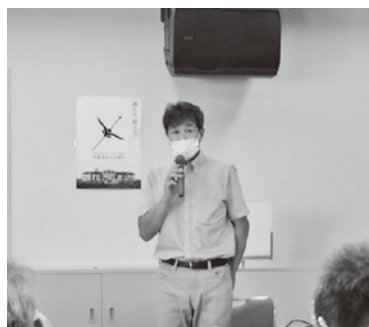
会議を進行する加島事務局長