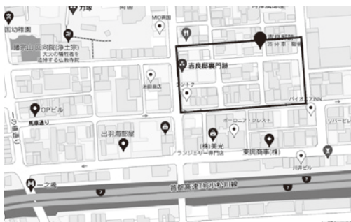
太線で囲った部分が討ち入り当時の吉良邸