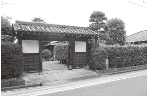
武家屋敷風の門と生け垣

所在地は六軒町二丁目、というよりは蓮馨寺の西、仲町から日高県道へ抜ける南北の通りである大工町と云った方が分かりやすいかも知れませんが、ここは、大工職人が起こした町と言われていますが、江戸時代に