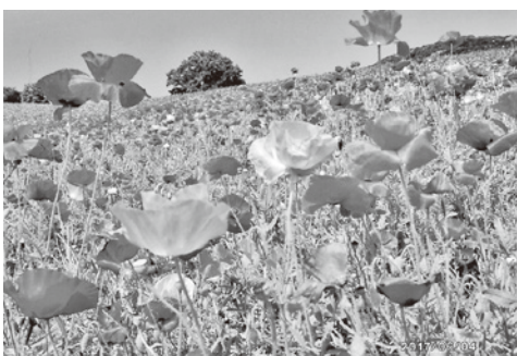
奥武蔵ひなげしの丘