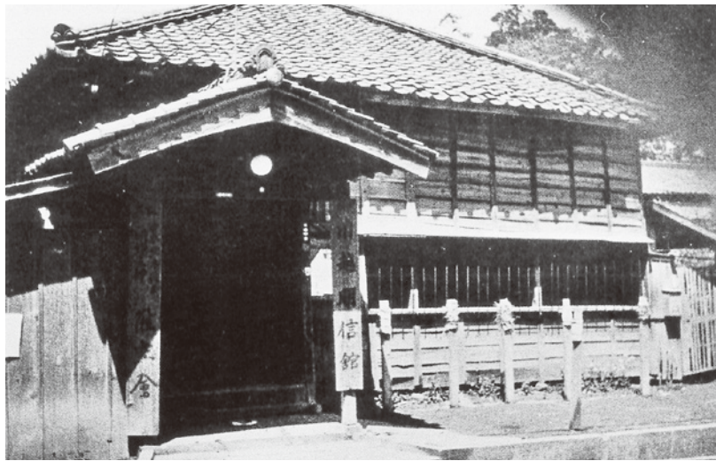
在りし日の川越明信館